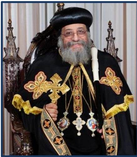
His Holiness Pope Tawadros II